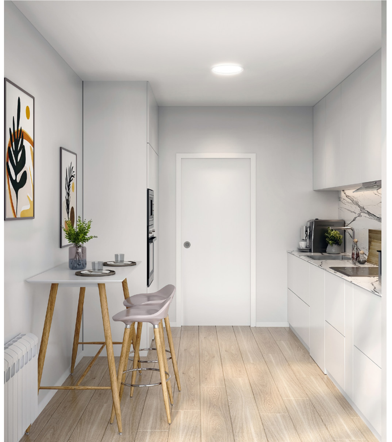
Promotora Reina | Son Marill