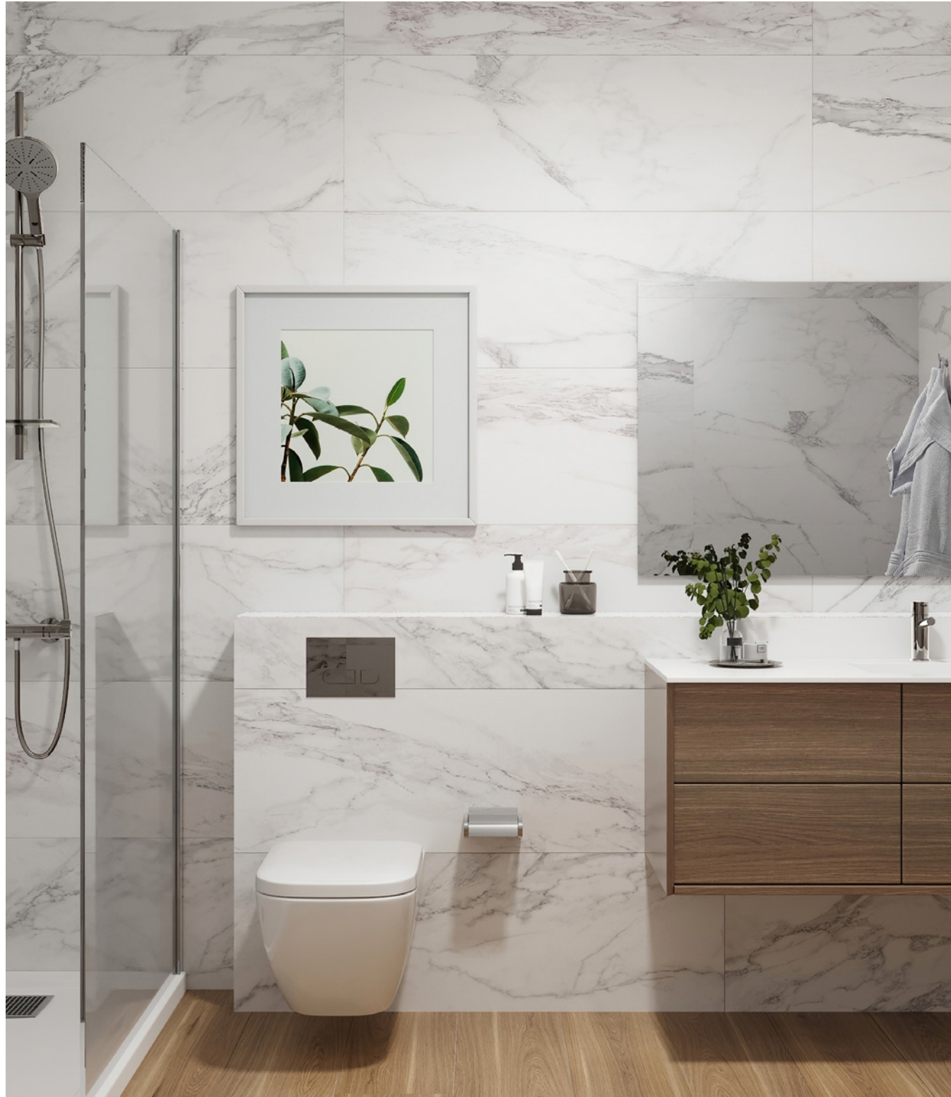
Promotora Reina | Son Marill